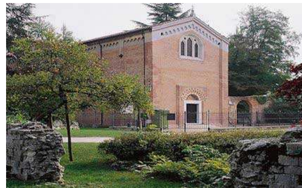
Cappella degli Scrovegni affrescata da Giotto

Città con un centro storico ricco di opere d'arte